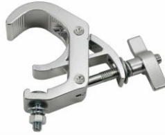
FOS SUPER SPAUSTUVAS 200

Profesionalus spaustukas Profesionalus spaustukas armatūrai, keliančiai 200 svarų armatūrai, keliančiai 200 svarų