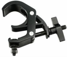
FOS SUPER SPAUSTUVAS 200

Dėklas skrydžiui su ratukais 8 „Pro“ ir „T“ serijos įrenginiams