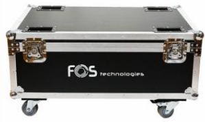
FOS dėklas 8in1 PAR PRO

Dėklas skrydžiui su ratukais 8 „Pro“ ir „T“ serijos įrenginiams